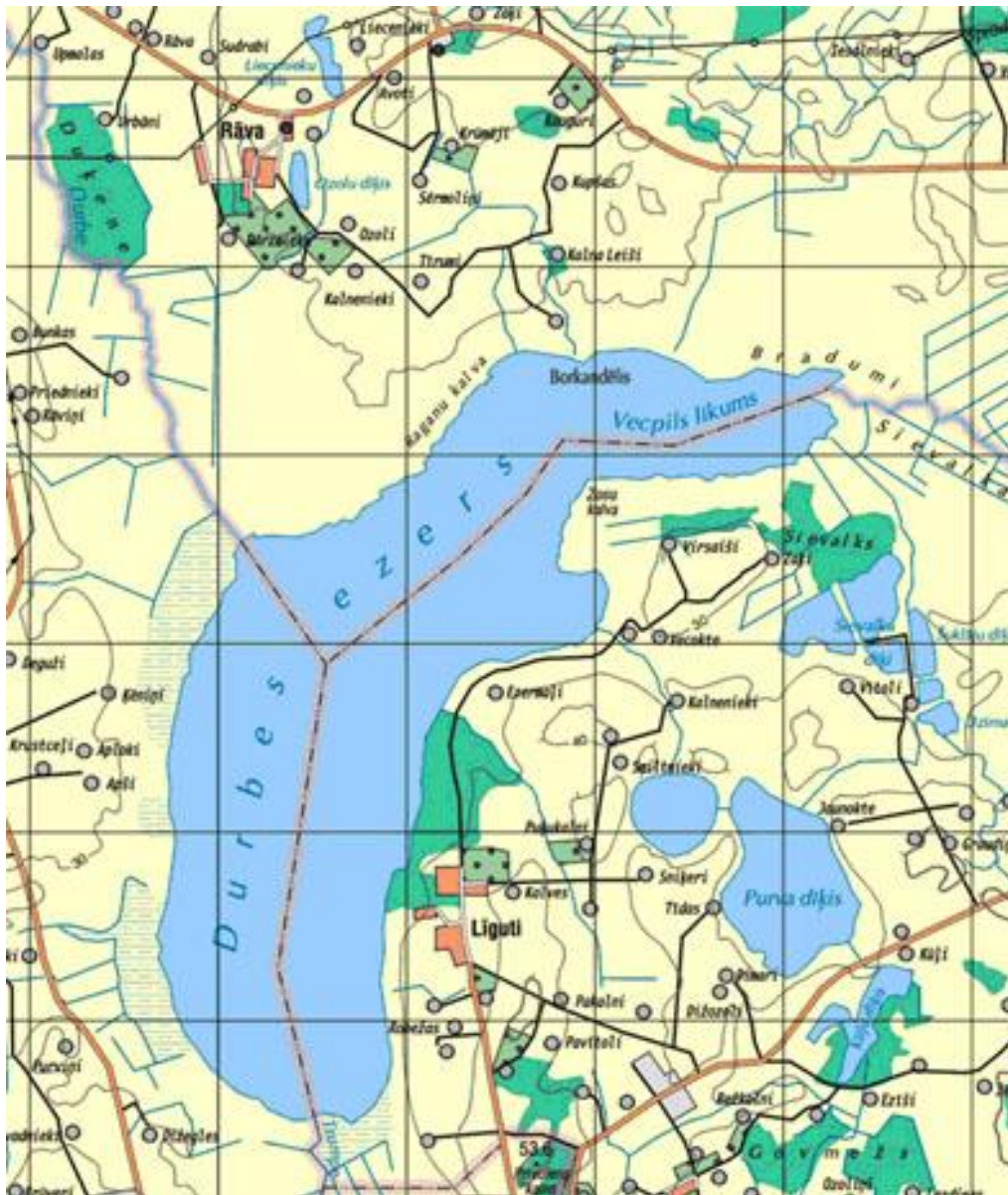
Durbes ezera shēma.